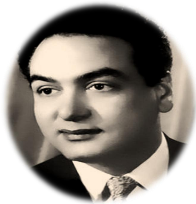
Mohamed FAWZI (1918 –1966)

au responsable de SAWT AL ARAB "صوت العرب" de composer et d'enregistrer une musique avec ses propres moyens et dans son propre studio, le résultat est satisfaisant. Ce troisième essai sera le bon et retenue finalement ; et c'est cette partition qui est montée au maquis, porteuse des espoirs et des sacrifices ultimes d'une génération d'Algériens pour que vive enfin leur patrie libre et indépendante. Et c'est cette même partition que tous les Algériens chantent aujourd'hui, depuis son adoption officiellement comme l'hymne national de l'Algérie indépendante.