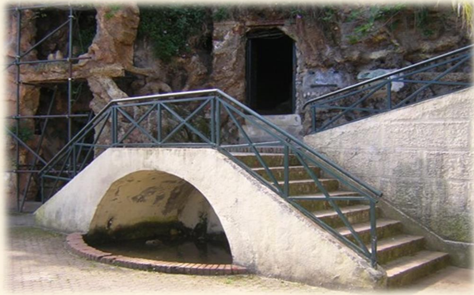
Restauration et aménagement de la grotte de Cervantès