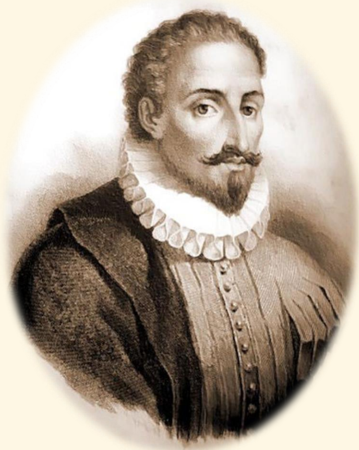
Miguel de Cervantès Saavedra (1547-1616)

U n élément naturel historique de la banlieue de la Médina d'EL-JAZAIR au 16 ème siècle est la grotte refuge du prestigieux écrivain espagnol Miguel de Cervantès (1547-1616), auteur de l'immortel roman " Don Quichotte de la Manche ". Miguel de Cervantès est né le 29 septembre 1547 à Alcalá de Henares (nord-est de Madrid) en Espagne et mort le 23 avril 1616 à Madrid, est un romancier, poète et dramaturge espagnol, il mène d'abord une vie aventureuse de soldat et participe à la bataille de Lépante en 1571, où il perd l'usage de la main gauche. Cette main paralysée lui vaut le surnom de "Manchot de Lépante".