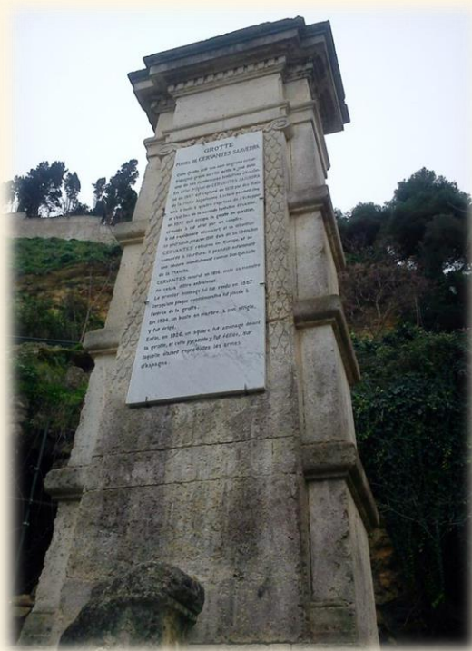
La plaque commémorative du séjour de l'auteur Miguel de Cervantès à Alger (1575-1580)